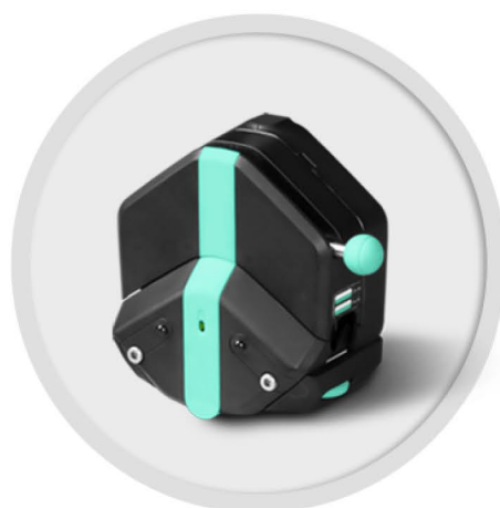
EasyPump-PPS 系列 (不可调压)