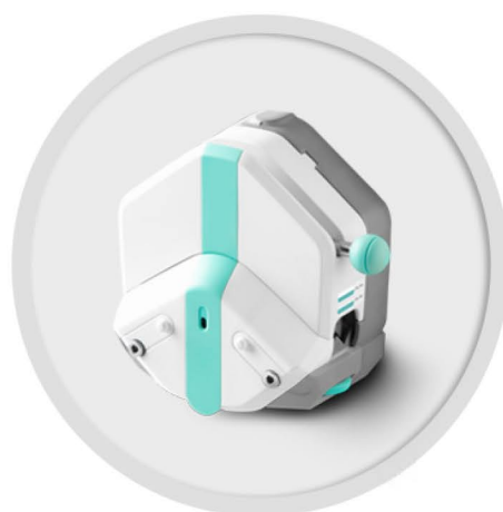
EasyPump 系列 (不可调压)